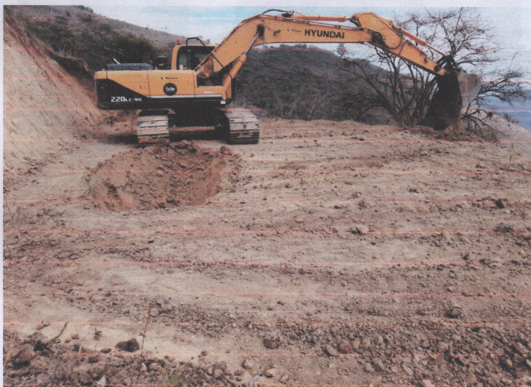
Construcción de Pozos