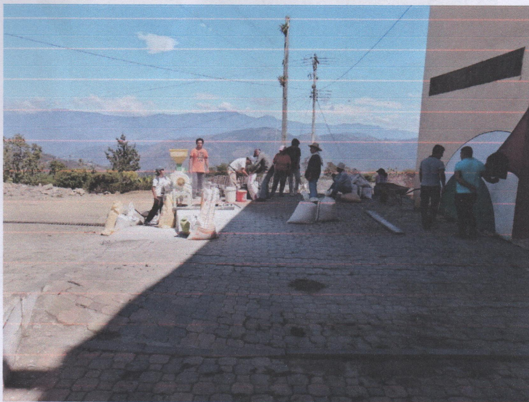
Apoyo al Sector Productivo