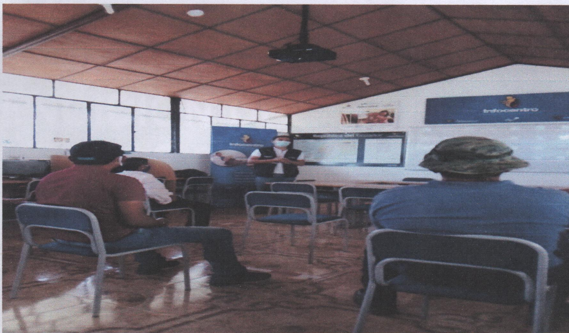
Reunión con gestores del proyecto de Infocentros