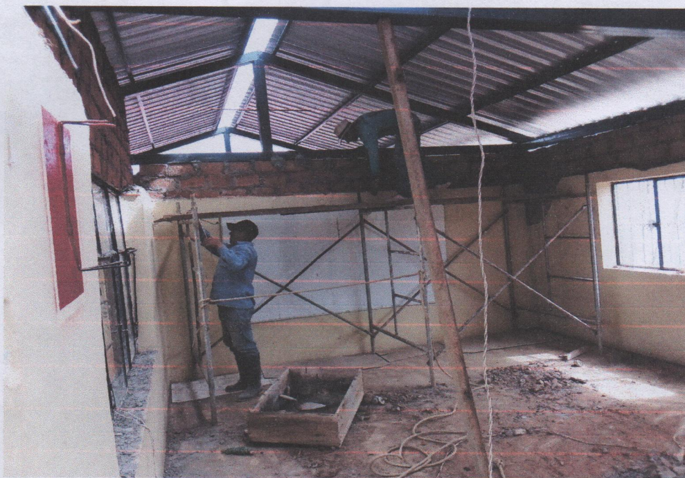
Convenio Reconstrucción Escuela Tres de Mayo