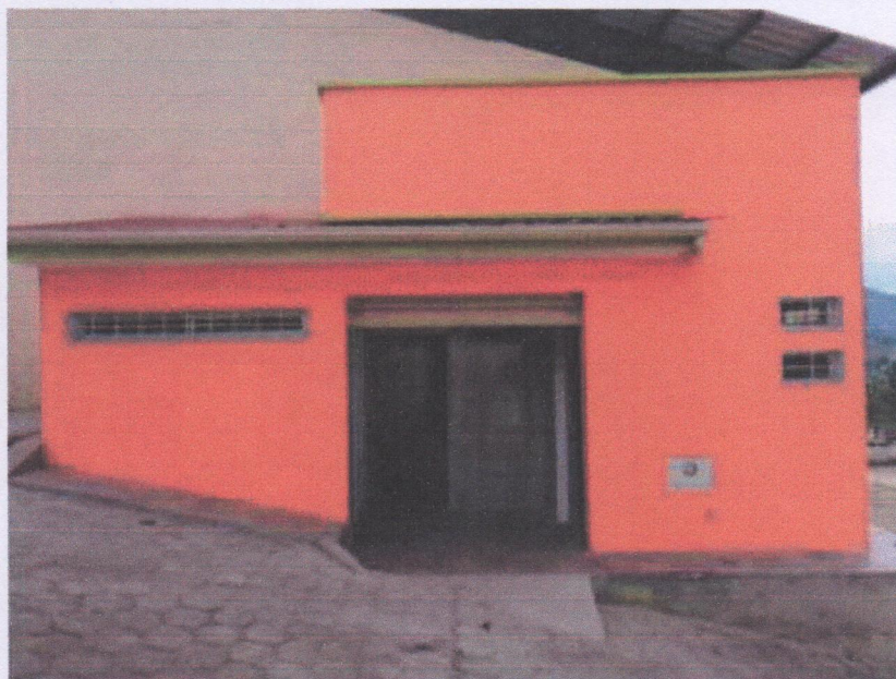
Batería Sanitaria 2019