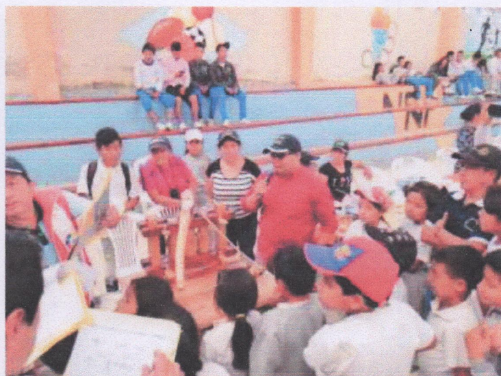
I Expo feria – Nueva Fátima 2019