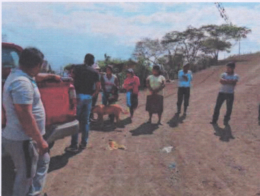
Ayuda a la Comunidad